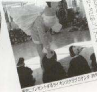
児童にプレゼントするライオンズクラブのサンタ (77年)

園児にサンタがプレゼント 加西・加西北条ライオンズクラブ 十七日二十四日の園児、 市内の幼稚園、保育園、 幼稚園、小学校、無防 園を訪問して、「サンタ さんにお菓子のプレゼント が、赤い服に白いひげの サンタクロースに扮し、 児童にプレゼントするライオンズクラブのサンタ (77年)