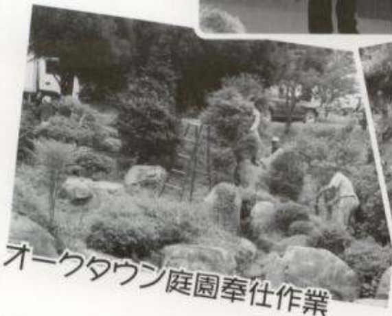
オークタウン庭園奉仕作業