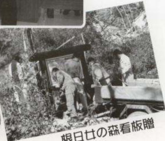
根日社の森看板贈