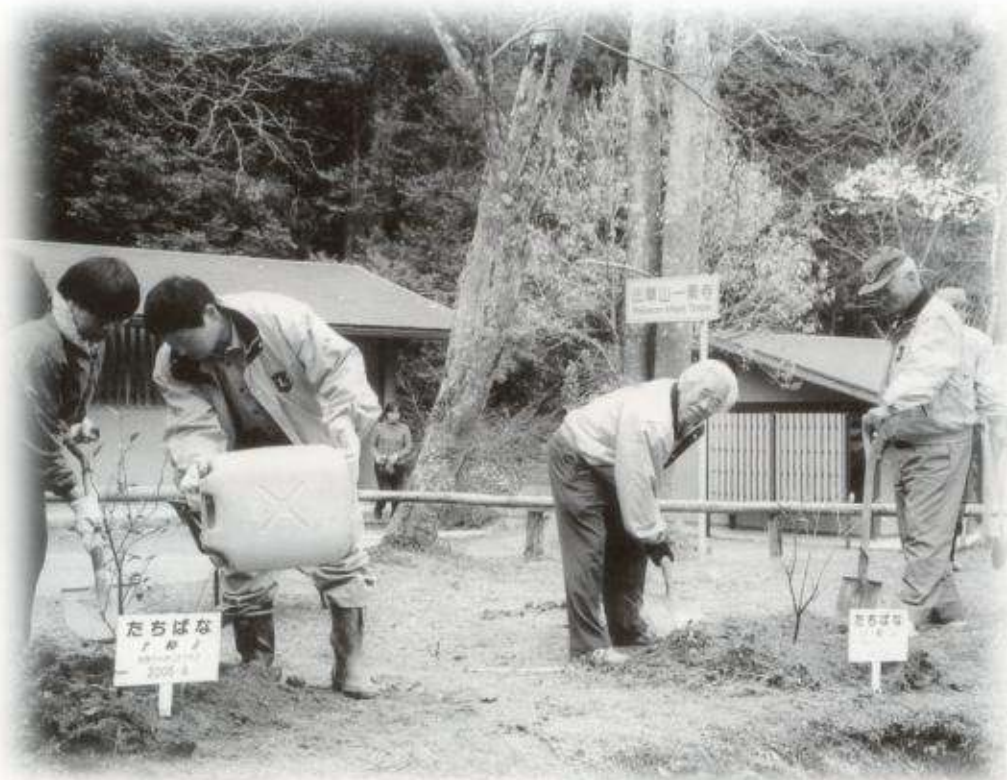
法華山一乗寺「たちばな」の苗木植樹