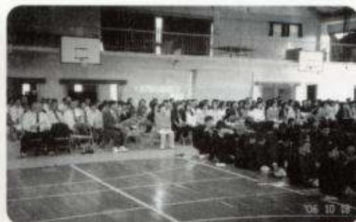
泉中学校にて開催