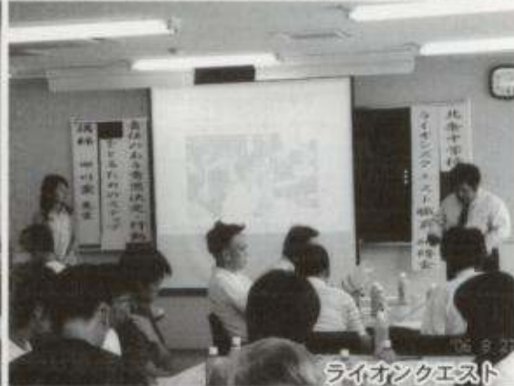
ライオンクエスト