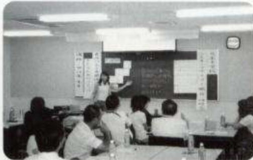
北条中学校にて開催

加西ライオンズクラブがライオンズクエスト事業を通して、これからの青少年健全育成に貢献していくことは、地域社会から更に高く評価されると信じ、頑張っておりまますので、更なる協力とご指導を、よろしくお願い申し上げます。