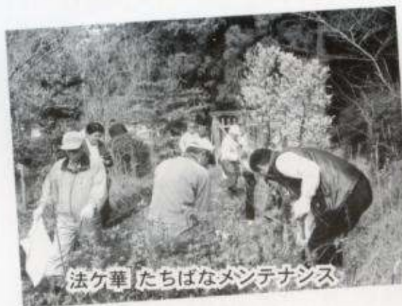
法ヶ華 たちばなメンテナンス