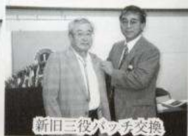
新旧三役パッチ交換