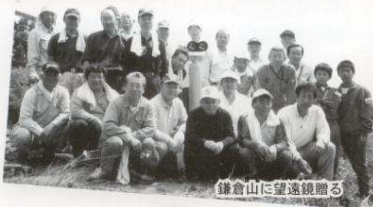
鎌倉山に望遠鏡贈る