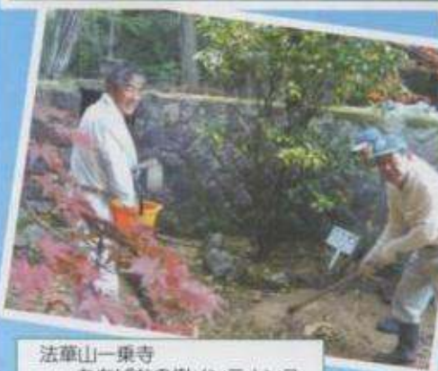
法華山一乗寺 たちばなの樹メンテナンス