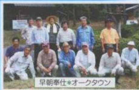
早朝奉仕*オークタウン