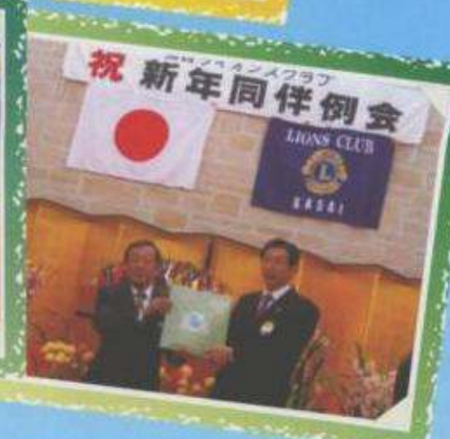
祝 新年同伴例会 LIANS CLUB KASAI