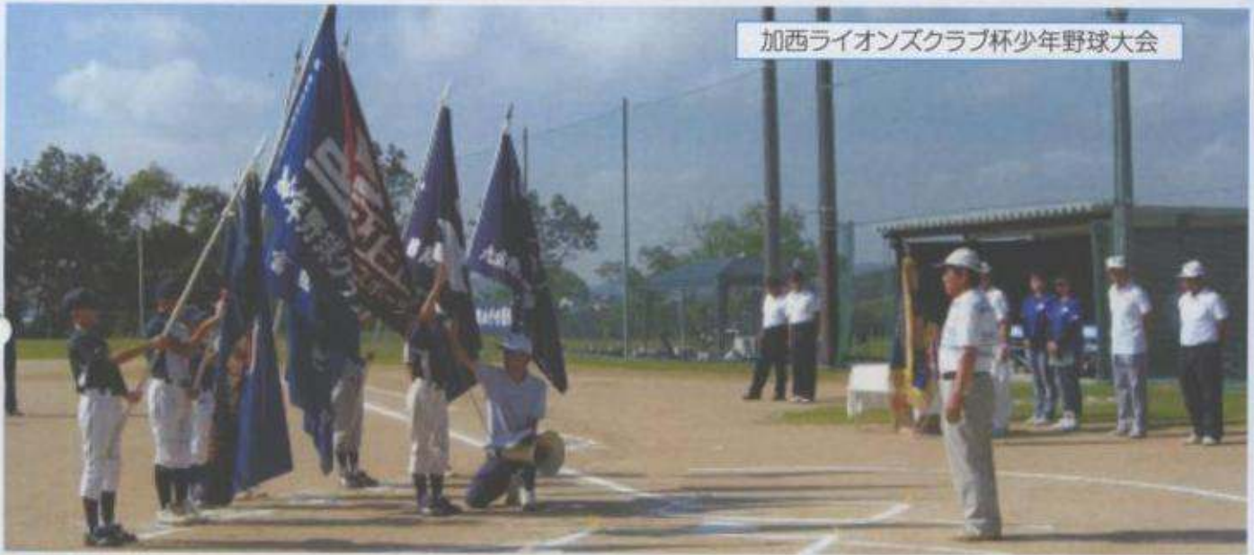
加西ライオンズクラブ杯少年野球大会