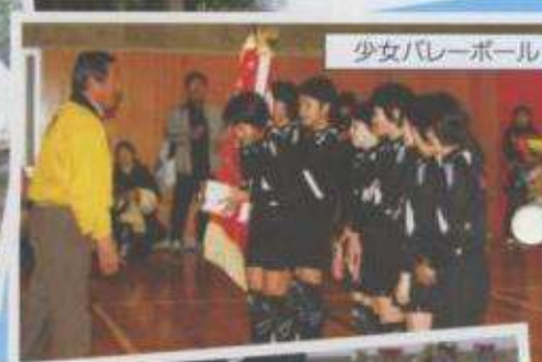
少女バレーボール