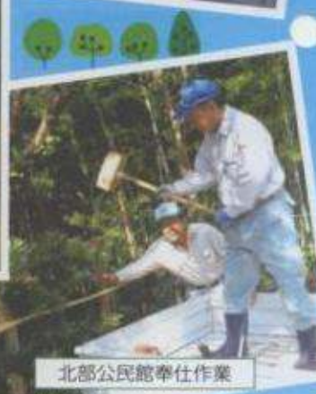
北部公民館奉仕作業