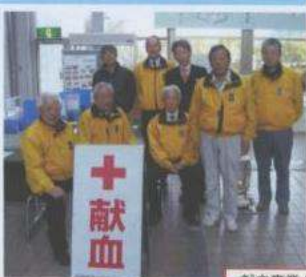
献血事業(加西市役所にて)