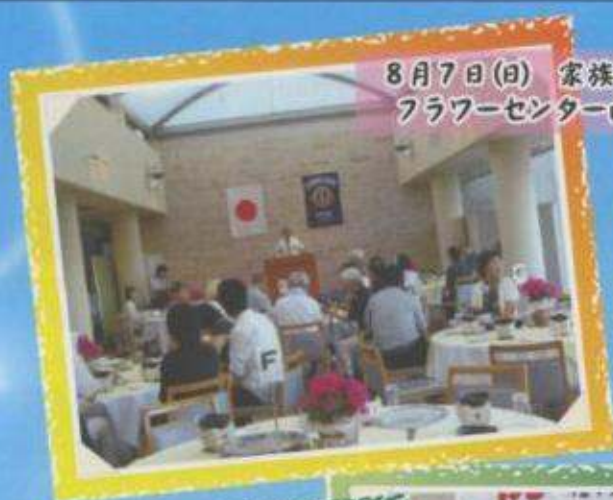
8月7日(日) 家族納涼例会 フラワーセンター内「フルール」にて

又、この一年間の活動と研修し勉強してきたことを今後のクラブライフに反映していきたいと思っています。皆様には、一年間ご支援を頂き有り難うございました。