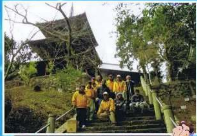
法華山一乗寺たちばなの樹メンテ