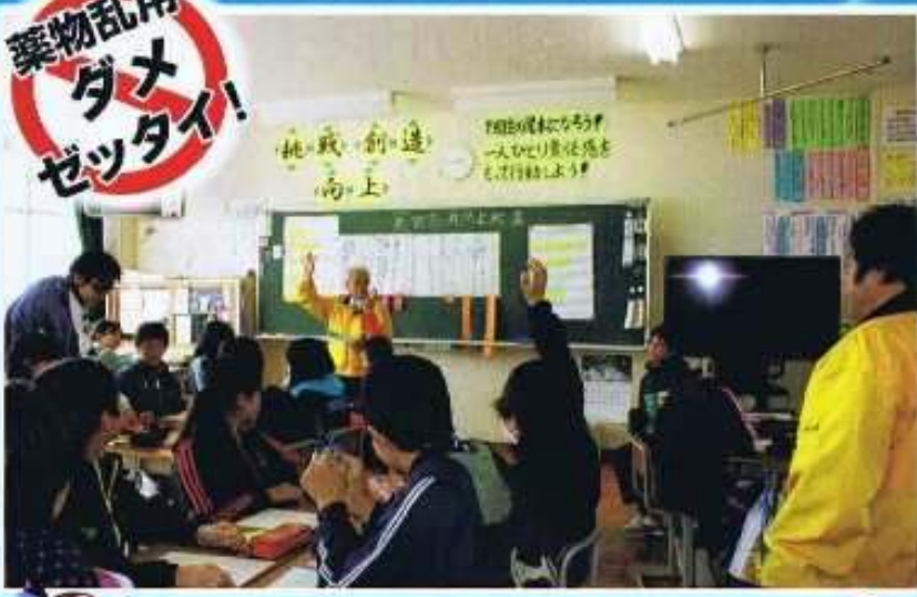
加西市立北条東小学校で薬物乱用防止教室