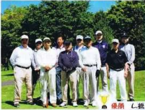
優勝 し 橋爪