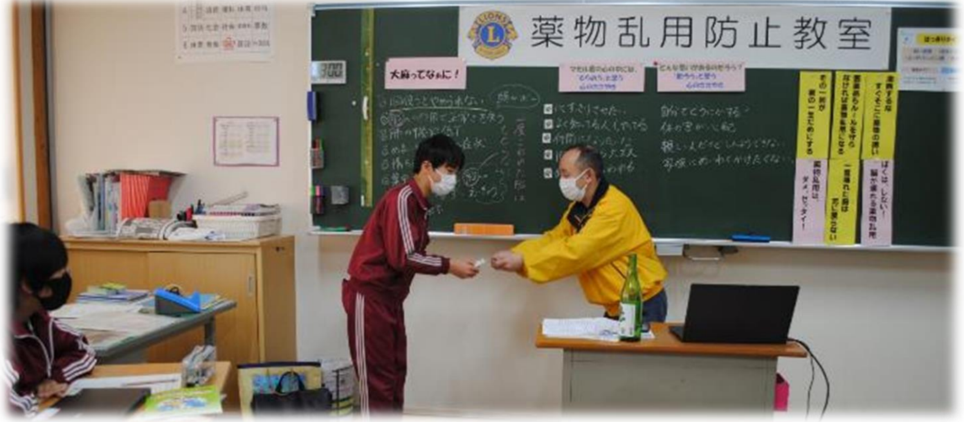
最後に感想文を書くことで、もう一度、今日の授業を振り返ろう